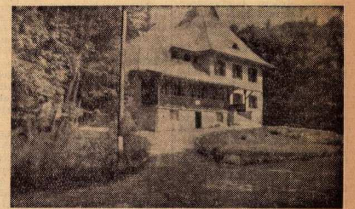
A postászsakszervezet erdei üdülője Zircen

Ez év május 15-én ismét megnyílt a postás szakszervezet egyik legkedvesebb üdülője, a zirci erdei ház, ahol ragyogóan tiszta, virággal feldíszített szobák vártak a pihenni vágyó dolgozókat. Ahogy kilépünk az üdülőből, már az erdőben vagyunk. Fenyőillat mindenütt és kedves erdei sétányok. Az üdültől néhány percre már szép tisztások vannak.