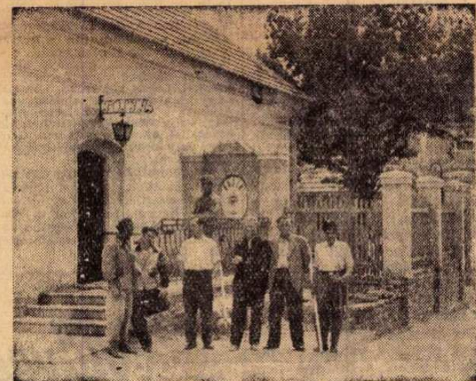
A postai építőbrigád tagjai, akik a Posta Tervező Intézet tervei alapján újjávarázsolták a tihanyi postahivatalt