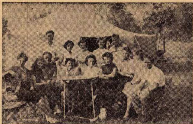
Június 7-én, vasárnap a Posta Oktatási Központja a megnyitást előtti kirándulás keretében mutatta be a sátorbort.

Az izlésesen berendezett hálsátorok, a kultur- és ebédlősátrak kényelmes nyaralást