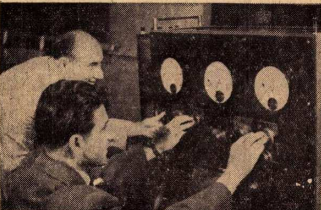
Pesti László akkumulátor indítóképeségvizsgáló készüléke